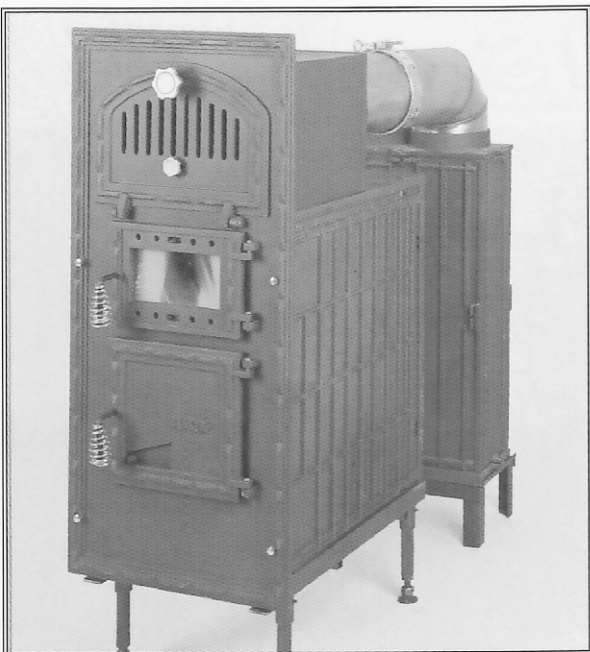
HA 12 K vario,